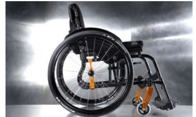
Version Potences Fixes

EXPLOREZ LE MONDE. REALISEZ VOS REVES. PRENEZ LE CONTROLE ET SURPASSEZ-VOUS.