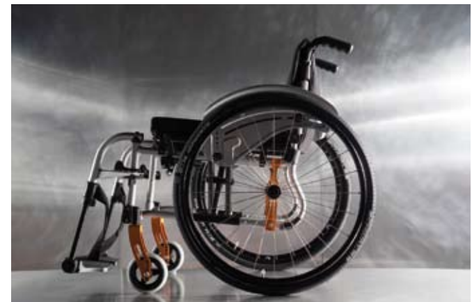
Version Potences Escamotables